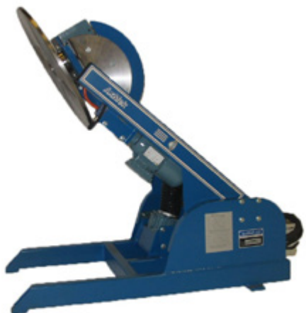
Tiltningsvinkel 165° Steglös inställning av alla lägen.