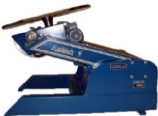
Steglös inställning av alla lägen.