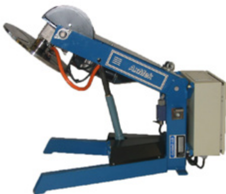
Tiltningsvinkel 165° Steglös inställning av alla lägen.